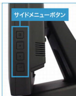
サイドメニューボタン