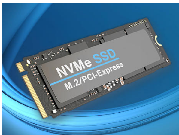
より高速な NVMe 対応 SSD にも対応