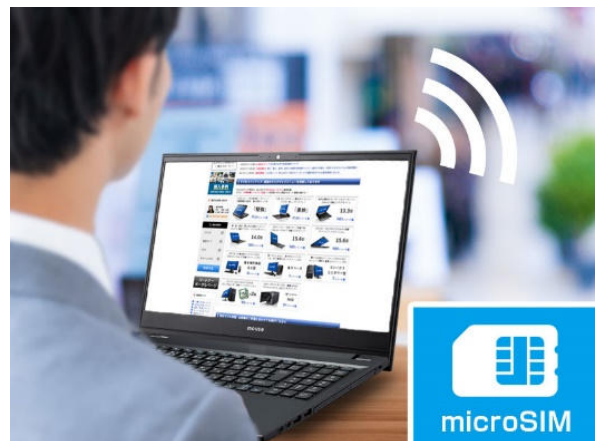
3 キャリア対応で広いエリアで接続できる「LTE」