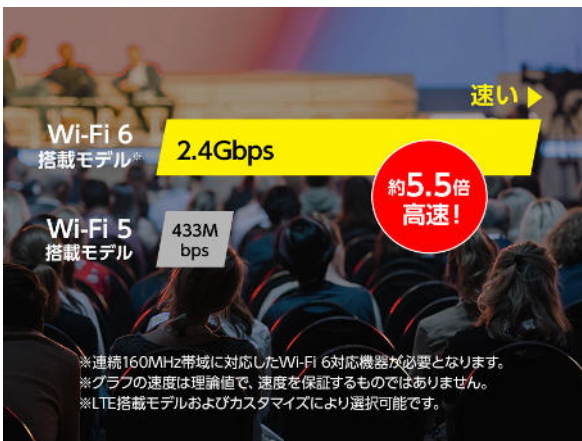
大幅に高速化した無線 LAN「Wi-Fi 6」

※5 40W（20V/2A）以上を出力可能な USB Power Delivery 対応機器が必要です。