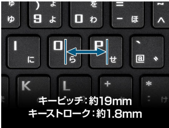
キーピッチ約 19mmの余裕あるキーレイアウト