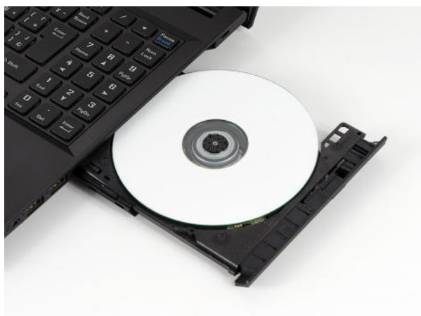
カスタマイズ可能な内蔵光学ドライブ