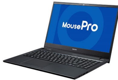
「MousePro NB5」シリーズ ※画像はイメージです