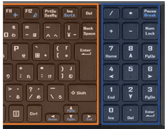
主要キーエリアからスペースを設けた独立テンキー