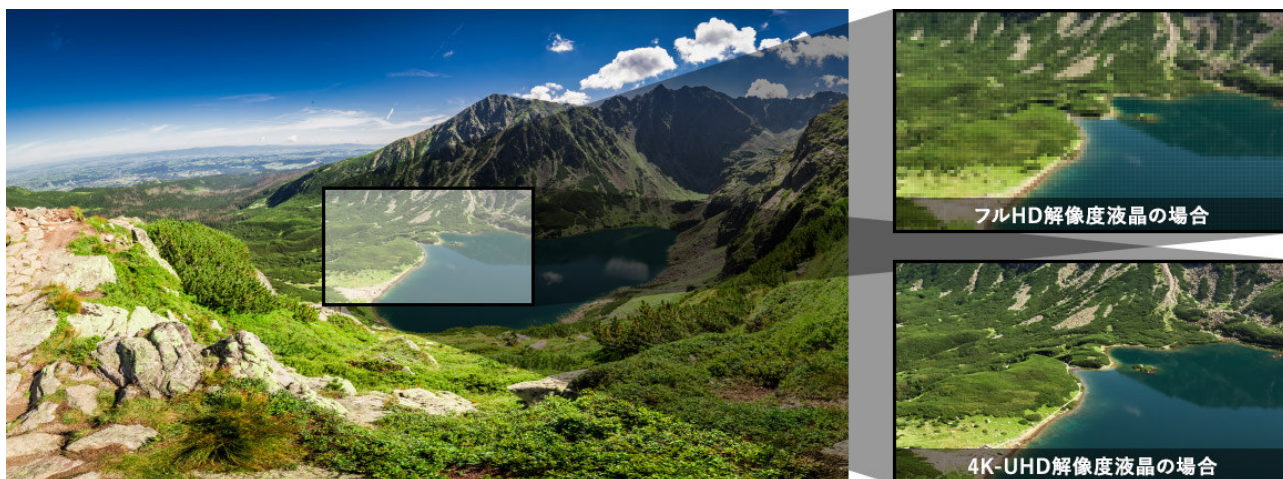
フル HD の 4 倍の解像度できめ細かく美しい 4K-UHD の高精細表示(イメージ)