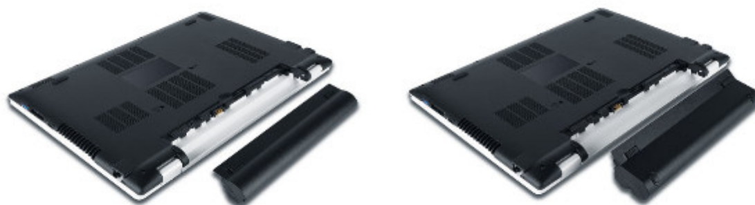
着脱可能なバッテリーパック 本体&標準バッテリー（左） / 本体&大容量バッテリー（右）

もちろん、最大32GB まで拡張可能なメモリや、データ転送速度に優れた NVMe 対応 SSD などカスタマイズすることができるので、使用用途にあわせた「あなただけのパソコン」をお選びいただけます。