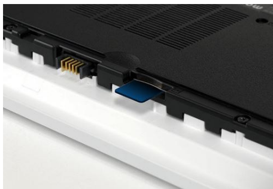
本体底面 LTE 用 SIM スロット