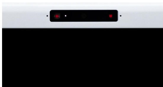
Windows Hello 対応 顔認証カメラ

顔認証カメラは、200万画素のフル HD 解像度 WEB カメラとしても使用できるので、SNS やコミュニケーションアプリのカメラとしても利用が可能です。