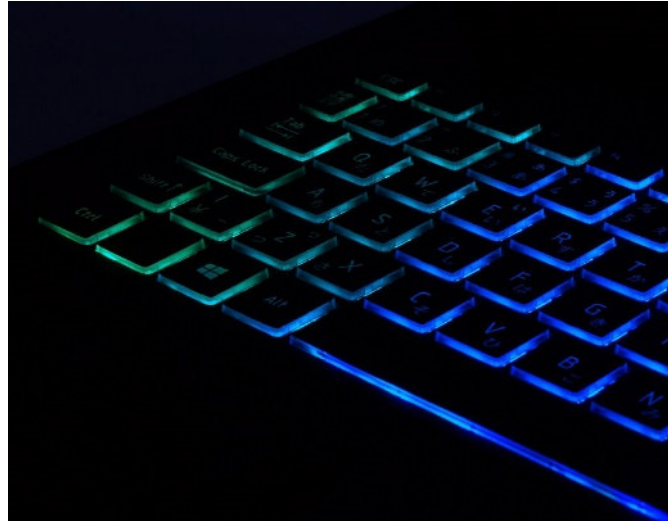
LED バックライト搭載キーボード

キーボードは、キーピッチ18.5mm のフラットキーを採用するとともに、LED バックライトを搭載することで、入力しやすく高い視認性を確保しています。また、LED が点灯することにより、暗い部屋でのゲームプレイでもキーを見失う可能性を低減し、ゲームへの没入感を高めることができます。