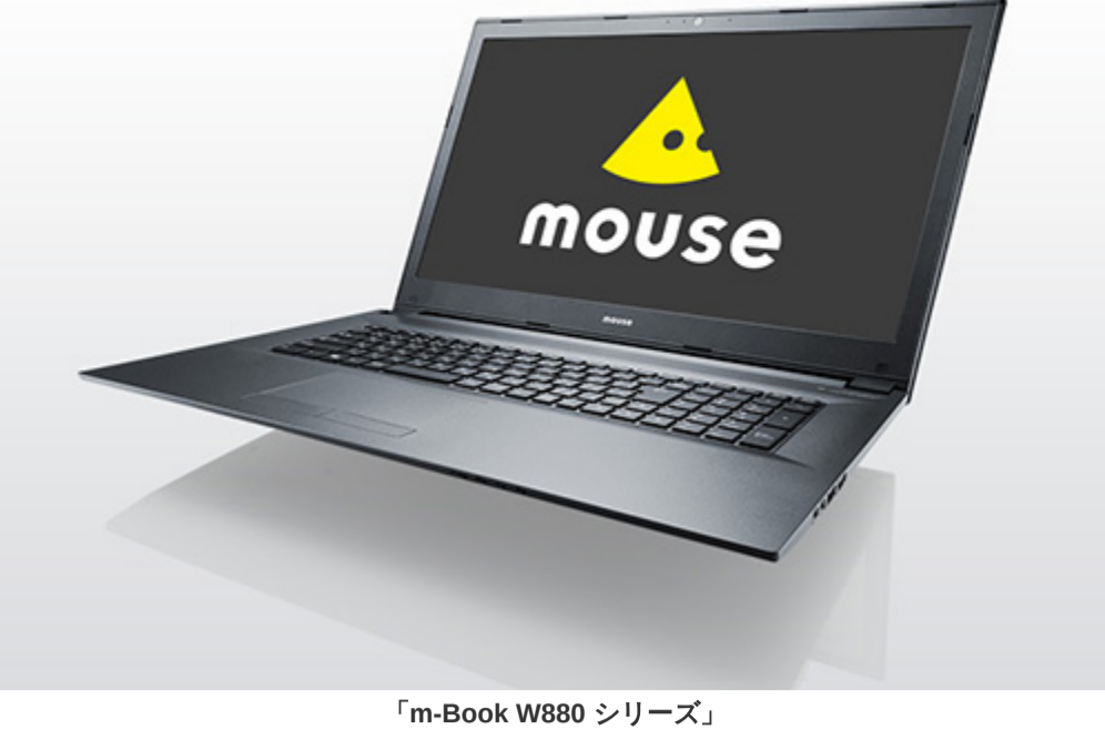
「m-Book W880 シリーズ」 ※ 画像はイメージです。

株式会社マウスコンピューター（代表取締役社長：小松永門、本社：東京都、以下マウスコンピューター）は、15.6 型と比較して約 1.2 倍大画面の 17.3 型液晶を内蔵し、最新の 6 コア CPU と高速グラフィックスを採用したノートパソコン「m-Book W880シリーズ」を 6月18日（月）より販売開始します。