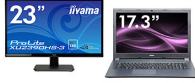
23 型フル HD ディスプレイと並べても 自然に見える画面サイズ