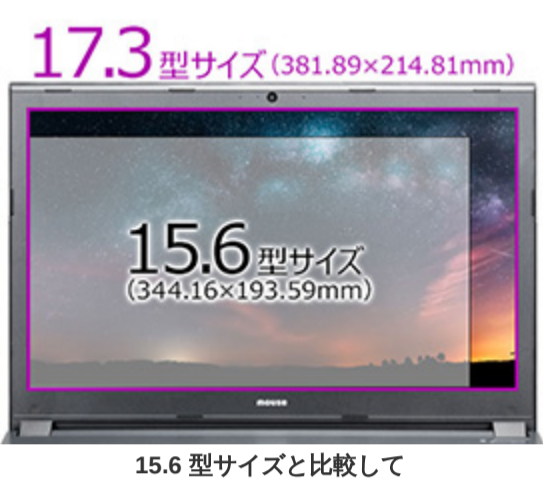
15.6 型サイズと比較して 余裕のある 17.3 型大画面

本製品は、一般的なノートパソコンで多く採用されている 15.6 型よりも表示面積が大きい 17.3 型フル HD 液晶画面を内蔵しています。15.6 型と比較して約 23% 広い画面は、文字表示も見やすく、複数のウィンドウを開いて作業をする場合でも、快適な操作が可能で、動画や写真なども大きな画面表示で楽しむことができます。また、外部ディスプレイを接続して、マルチディスプレイ環境で使用の際は、内蔵の液晶画面と外部ディスプレイとのサイズ差が小さく、組み合わせた画面表示環境でも、より自然にお使いいただくことができます。