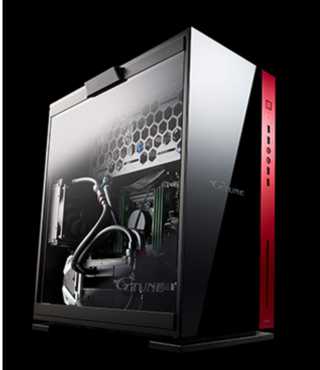
強化ガラス製サイドパネル採用「MASTERPIECE i1630PA3-SP2G」外観

スモーク加工された強化ガラス製のサイドパネルを採用したモデル「MASTERPIECE i1630PA3-SP2G」は、35万 4800円（税別）より、マウスコンピューター製品取扱量販店にて順次販売いたします。