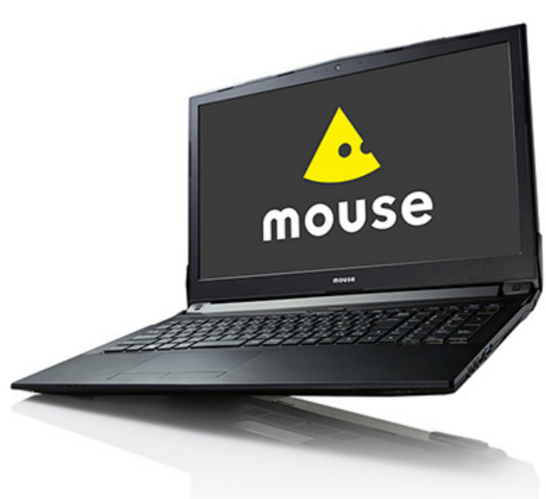
「m-Book K690 シリーズ」 ※ 画像はイメージです。