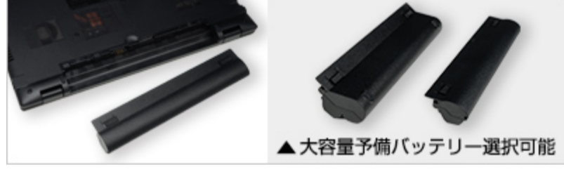
▲大容量予備バッテリー選択可能