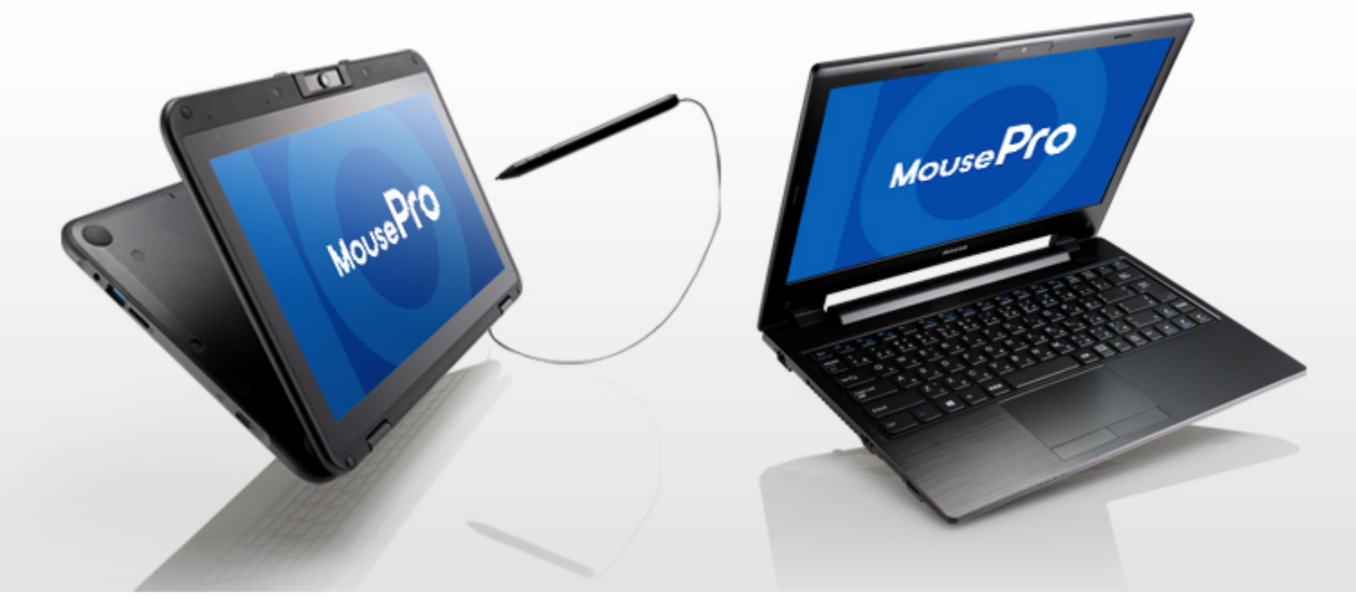
「MousePro P116Aシリーズ」、「MousePro NB391シリーズ」 ※画像はイメージです。