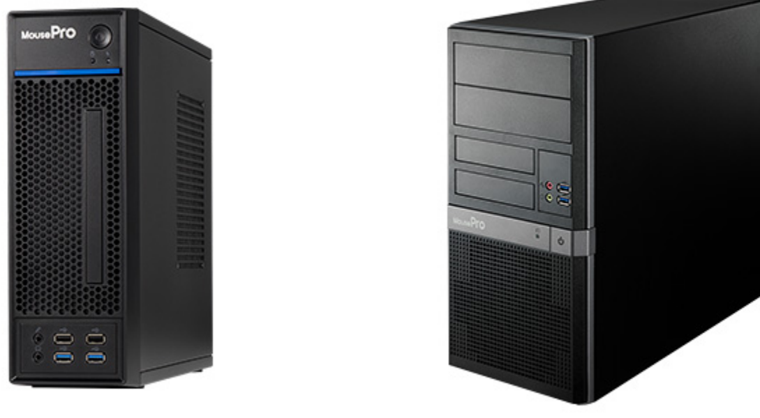
法人向け、デスクトップパソコン 「MousePro Sシリーズ」、 「MousePro Tシリーズ」 ※画像はイメージです。