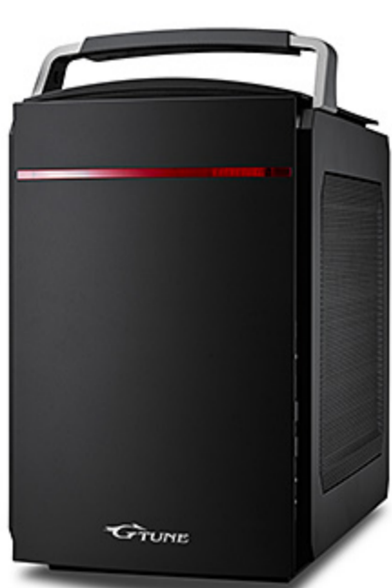
LITTLEGEAR i330BA1-MD ※ 画像はイメージです。