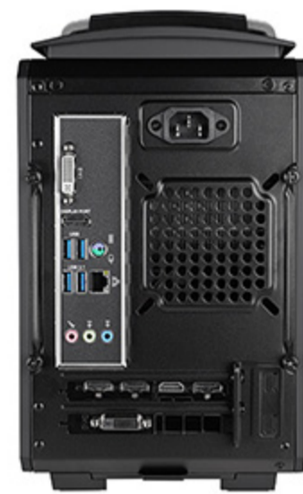
背面インターフェース