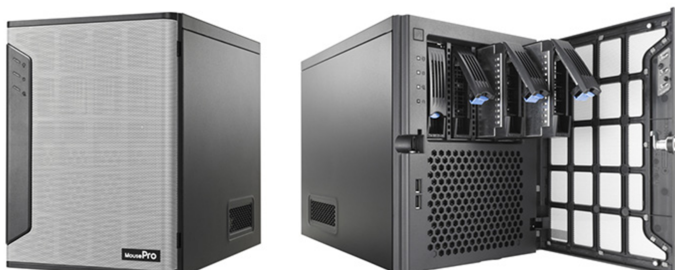
法人向けの小型サーバー「MousePro SV230ST シリーズ」 ※画像はイメージです。