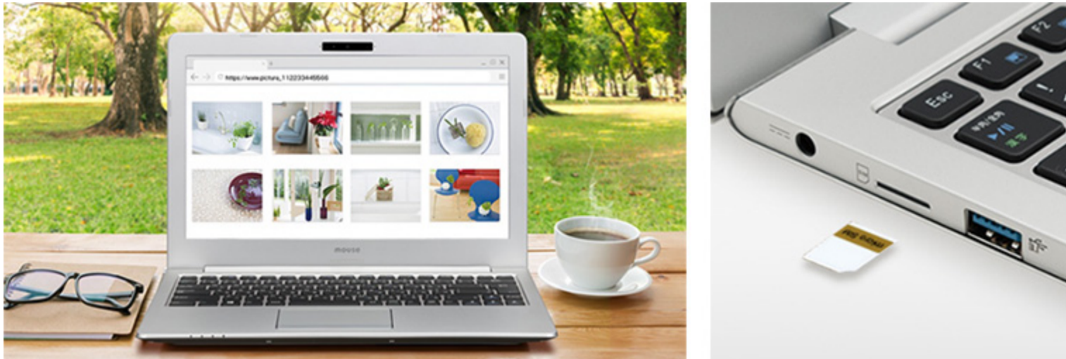
▲本体左側面micro SIMカードスロット

※1 SIMカードは同梱しておりません。内蔵のワイヤレスWAN機能をお使いいただくには、通信業者との契約が必要です。 ※2 海外での使用は保証対象外となります。