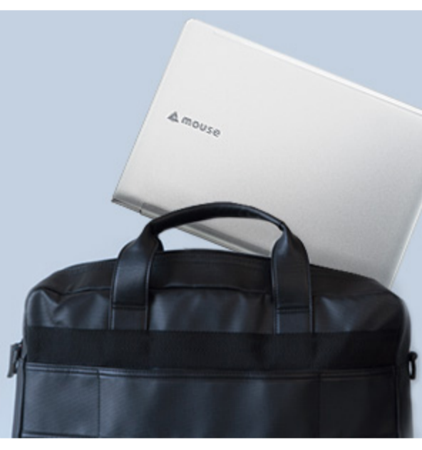
サイズ:幅329.8×奥行き225×高さ17.6mm(折り畳み時/突起部含まず) 幅329.8×奥行き225×高さ20.1mm(折り畳み時/突起部含む) 本体重量:約1.5kg(付属品含まず)