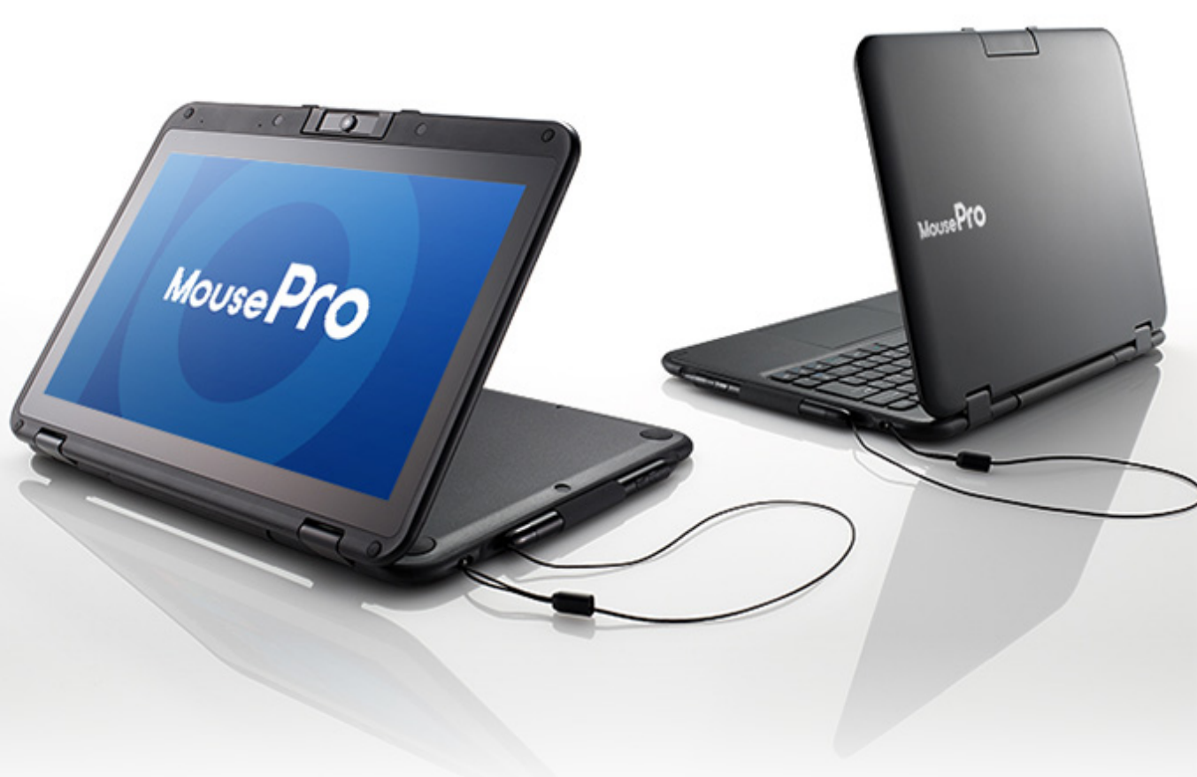
法人向け 2in1 タブレット 「MousePro P116シリーズ」 ※ 画像はイメージです。