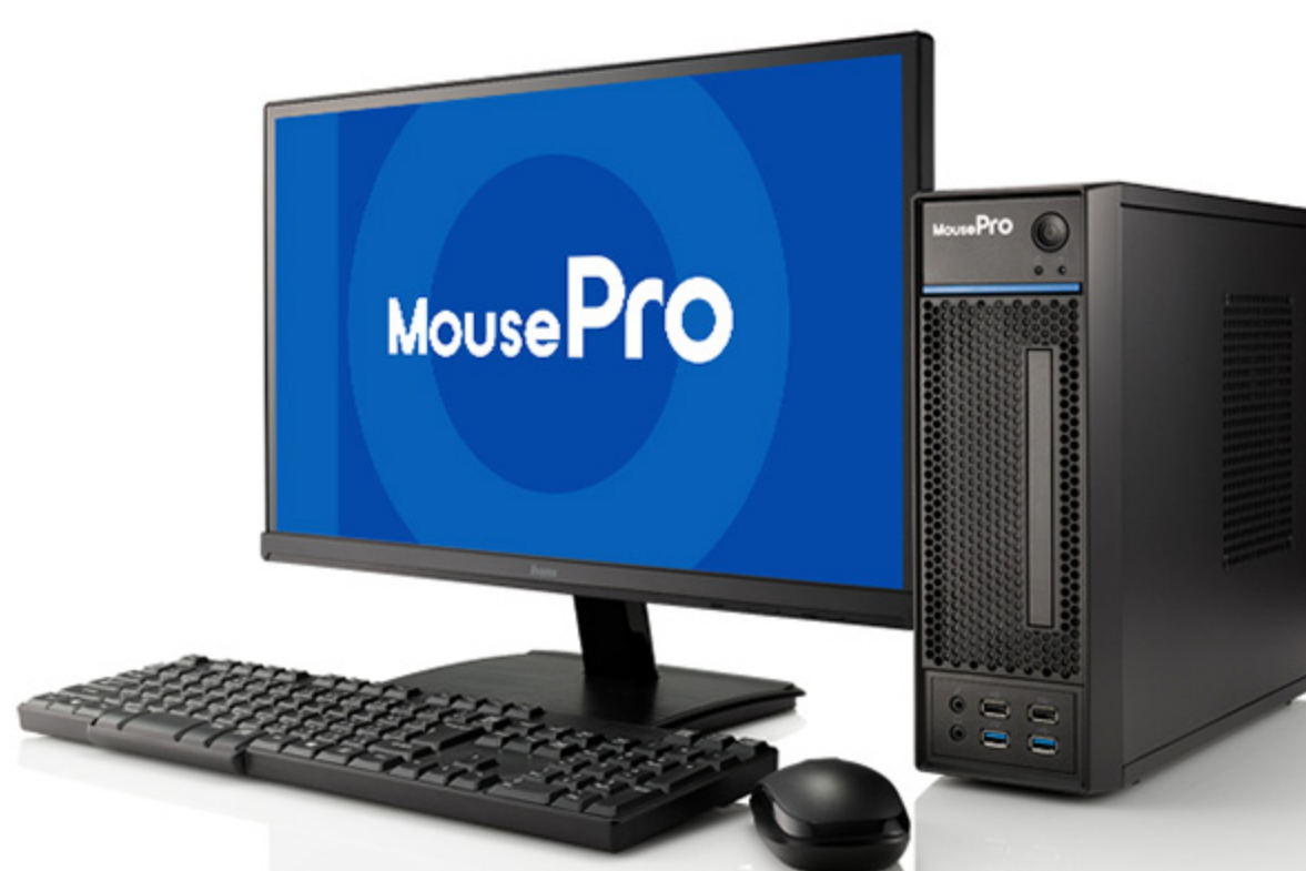
法人向けデスクトップパソコン「MousePro Sシリーズ」 ※画像はイメージです。※液晶ディスプレイはオプションです。