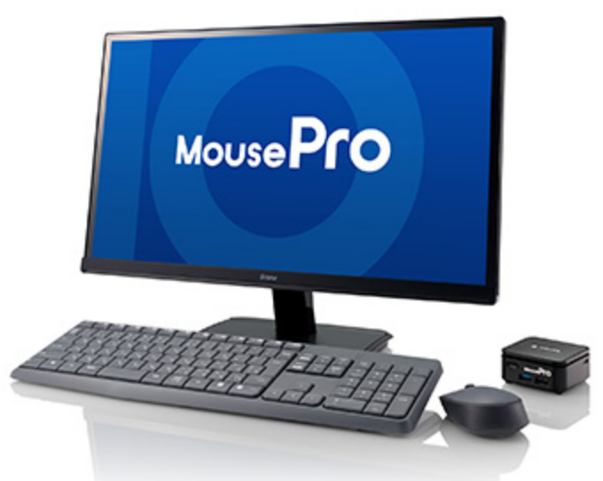
超小型パソコン「MousePro Cシリーズ」