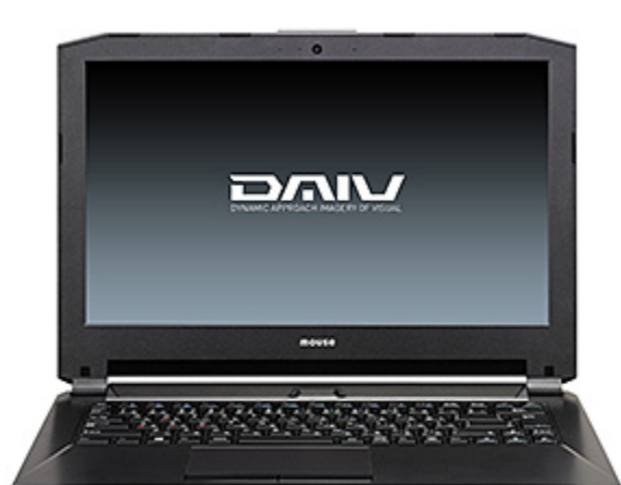
「DAIV-NG4500 シリーズ」 ※ 画像はイメージです。