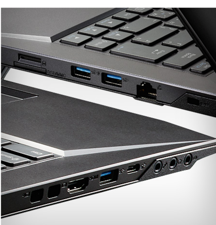
本体側面の豊富なインターフェイス

10Gbpsの転送速度に対応したUSB 3.1 (Type-C) 端子を1基、さらにUSB 3.0 (Type-A) 端子を3基、1000Base-T対応LAN端子やMini DisplayPort 2基、HDMI 1基など、大容量データ通信に最適な高速インターフェイスを多数搭載する事で、パソコン以外の機器との親和性を深めています。