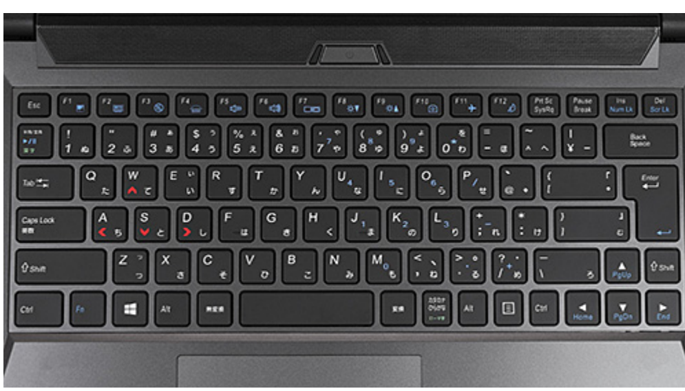
ホワイトLED/バックライト付キーボード

5段階の輝度調整が可能なホワイト LED バックライト付きのキーボードを搭載。周囲が暗い環境でもキーの視認性を向上し、操作性をアップしています。