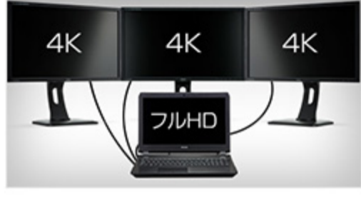
外部4K-UHD解像度対応 最大で4画面同時表示