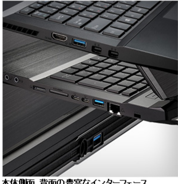
本体側面、背面の豊富なインターフェイス

10Gbpsの転送速度に対応したUSB 3.1 (Type-C)端子を2基、さらにUSB3.0 (Type-A) 端子を3基、1000Base-T対応LAN端子やMini DisplayPort 2基、HDMI 1基など、充実したインターフェイスを搭載しています。本体左側面には、HDMIとUSB3.0 (Type-A) を隣接配置しており、VR用HMD接続にも便利なレイアウトとなっています。外部映像出力端子は、Mini DisplayPort 2基、HDMI 1基を搭載し、すべて4K-UHD解像度に対応しており、内蔵ディスプレイを含めて、同時に4画面表示が可能です。