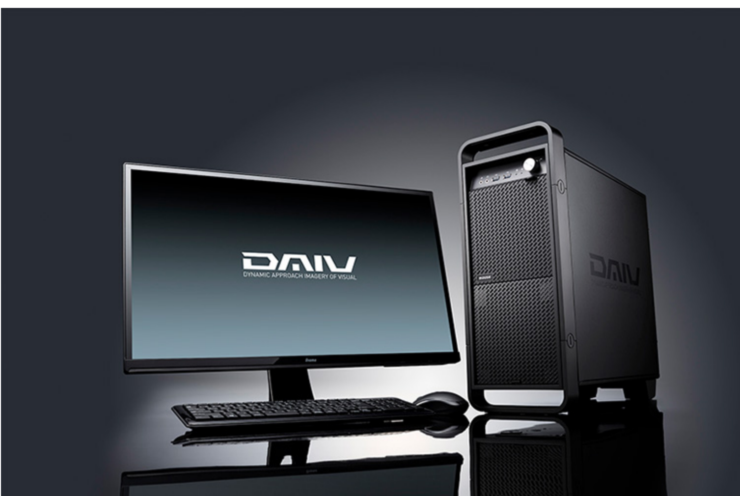
クリエイター向けPC 「DAIV-DGX715シリーズ」 ※ディスプレイ、キーボード、マウスはオプションです。

株式会社マウスコンピューター（代表取締役社長：小松永門、本社：東京都、以下マウスコンピューター）は、クリエイター向けPCブランド「DAIV(ダイブ)」シリーズでDual-Link SLIIに対応したハイパフォーマンスデスクトップパソコンを販売開始します。