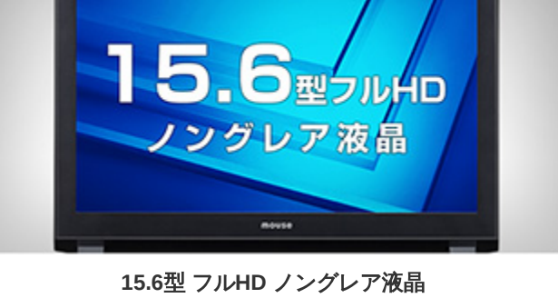
15.6型 フルHD ノングレア液晶

CPU と GPU の高いパフォーマンスによる描画能力を表現する液晶パネルは、一般的に使われることが多いフルHD 解像度に対応し、パネル表面は外光の反射を抑えるノングレア処理を施すことで、見やすく画面表示に集中しやすい環境を実現します。また、本体側面に配置されることが多い内蔵スピーカーは、使用時に正面に位置する本体ヒンジ部に大型ステレオスピーカーを配置することで、自然なサウンド環境を再現します。