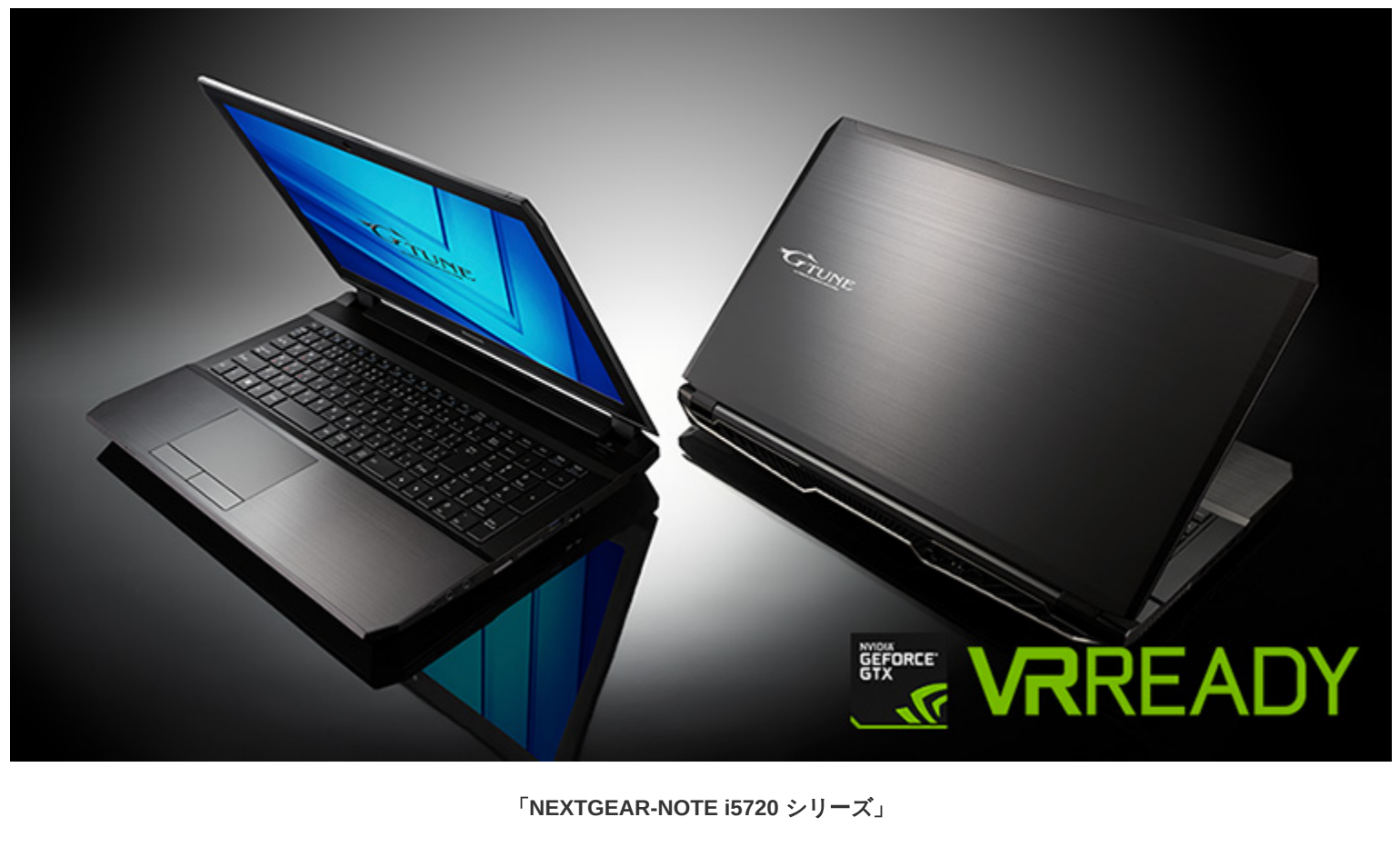
「NEXTGEAR-NOTE i5720 シリーズ」

株式会社マウスコンピューター（代表取締役社長：小松永門、本社：東京都）は、ノートブック向け最新世代グラフィックスの GeForce® GTX 1070（8GB）を搭載し、ゲームだけでなく VR にも適した 15.6型ハイパフォーマンスゲーミングノートパソコン「NEXTGEAR-NOTE i5720シリーズ」を 16万9,800円（税別）より販売いたします。