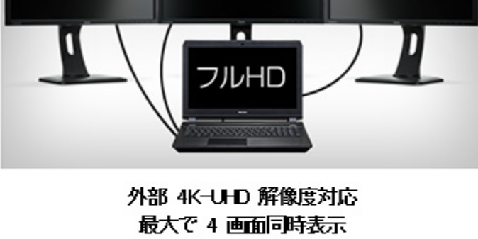
外部 4K-UHD 解像度対応 最大で 4 画面同時表示