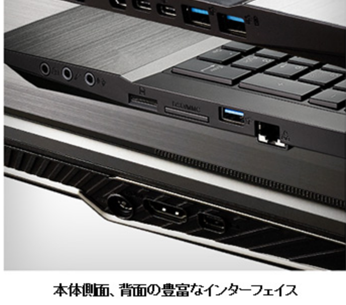
本体側面、背面の豊富なインターフェイス

また、ヘッドフォン出力にはサンプリングレート 24bit/192kHzに対応する ESS 製オーディオ DAC、TI 製 Burr-Brown アンプを搭載し、ノイズや歪みの少ない高音質なオーディオ出力に対応しています。