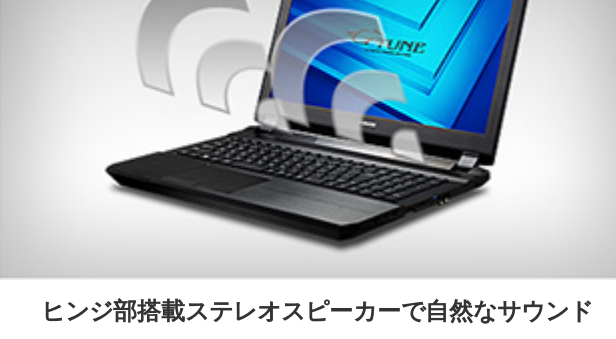
ヒンジ部搭載ステレオスピーカーで自然なサウンド