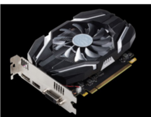
「GeForce® GTX 1050シリーズ」 ※画像はイメージです。実際に製品に搭載されるものとは異なる場合があります。

お求めやすい価格帯で、最先端のGPUアーキテクチャによるゲーミングパフォーマンスを実現することができるコストパフォーマンスに優れたグラフィックスです。