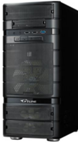
「NEXTGEAR-MICRO im570シリーズ」 ※画像はイメージです。