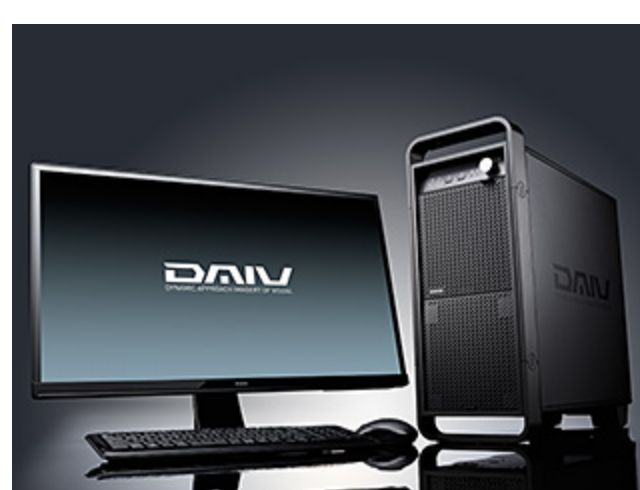
クリエイター向けPCブランド「DAIV」 DAV-D シリーズ