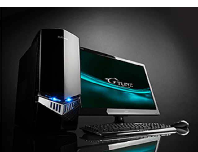
ゲームPCブランド「G-Tune」 NEXTGEAR シリーズ