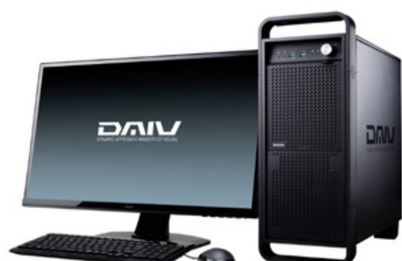
DAIV-Dシリーズ ※液晶ディスプレイは付属しません。