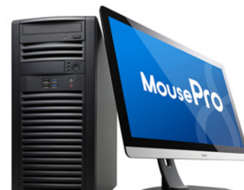
MousePro Wシリーズ ※液晶ディスプレイは付属しません。

株式会社マウスコンピューター（代表取締役社長：小松永門、本社：東京都、以下マウスコンピューター）は、最新のNVIDIA® Quadro® M6000 24GBメモリ版と、Broadwell-E/EPプロセッサを組み合わせた、物理ベースレンダリング、BIM環境解析・シミュレーション、複合材料モデリング、4K超高解像度・高ビットレート映像処理、全天球映像結合処理など、超高度なクリエイション・エンジニアリング用途に最適なワークステーションを発売開始いたします。