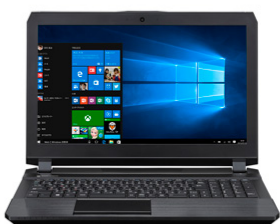
m-Book P シリーズ正面