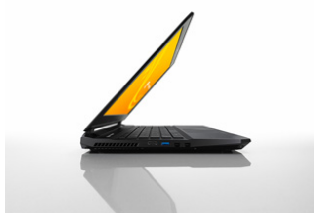
m-Book P シリーズ側面