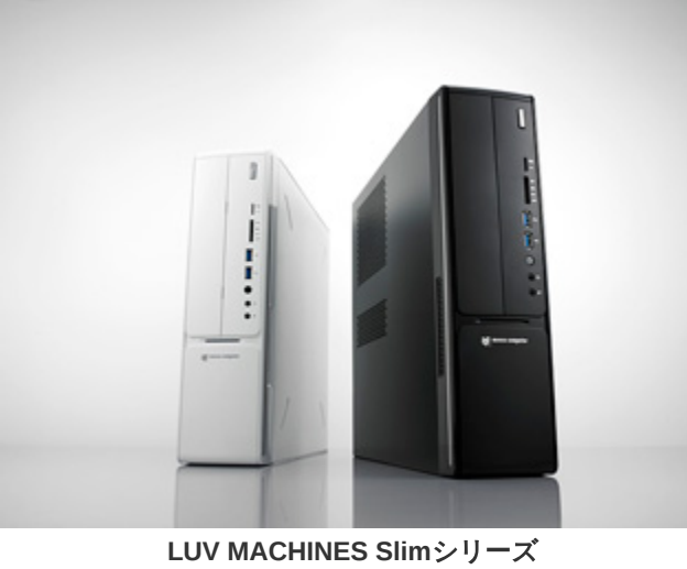
LUV MACHINES Slimシリーズ

株式会社マウスコンピューター（代表取締役社長：小松永門、本社：東京都、以下マウスコンピューター）は、インテル® 第6世代の最新CPU Core™ i3-6100を搭載し、当社採用のインテル® H110 Expressチップセットでは、ディスプレイ出力にD-sub、DVI-D、DisplayPortの3系統を備えた※1ミニタワー型デスクトップパソコン「LUV MACHINES シリーズ」を5万4,800円～(税別)、スリム型デスクトップパソコン「LUV MACHINES Slim シリーズ」を5万6,800円～(税別)で販売開始しました。Windows 10とWindows 7の両OSをお選びいただける他、パソコン本体の置き場所を選ばない小さい筐体とお求めやすい価格での新製品です。