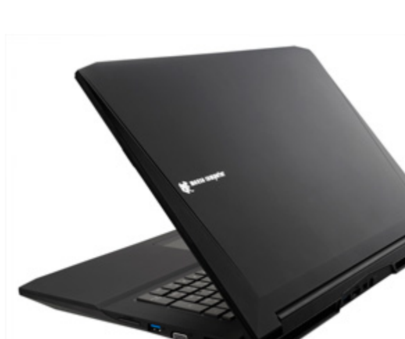
m-Book W シリーズ 背面