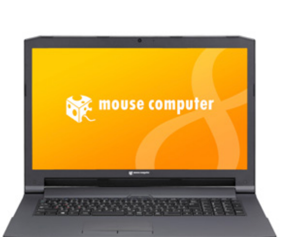
m-Book W シリーズ

～ 第4世代インテル® Core™ i7 プロセッサを搭載でマルチに使えるハイスペックモデル～ 2015.04.01