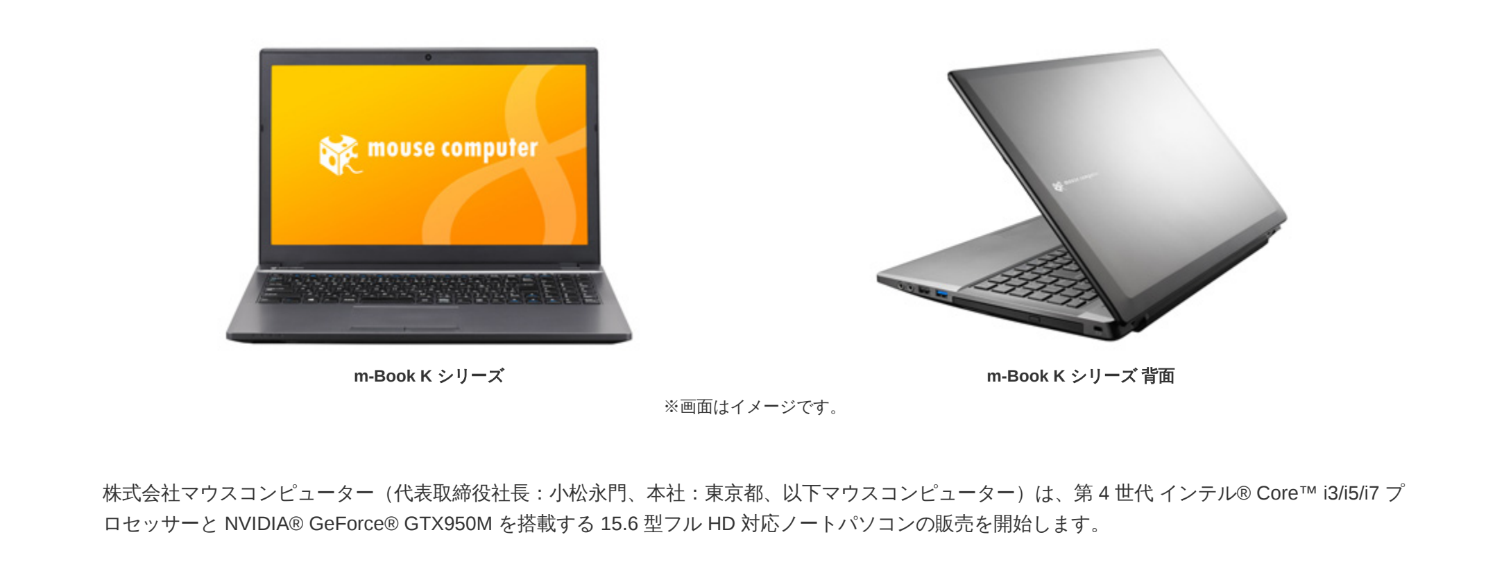
m-Book K シリーズ ※画面はイメージです。

株式会社マウスコンピューター（代表取締役社長：小松永門、本社：東京都、以下マウスコンピューター）は、第4世代インテル® Core™ i3/i5/i7 プロセッサと NVIDIA® GeForce® GTX950M を搭載する 15.6 型フル HD 対応ノートパソコンの販売を開始します。