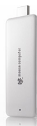
m-Stick シリーズ MS-NH1-64G

～ HDMI 端子接続で、すべてのTVやモニターをPCに～ 2015.03.06