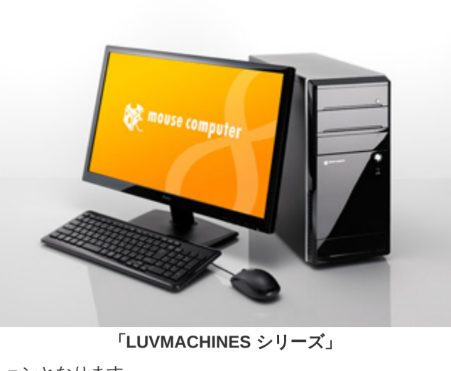
「LUV MACHINES シリーズ」 ※画像はイメージです。ディスプレイはオプションとなります。