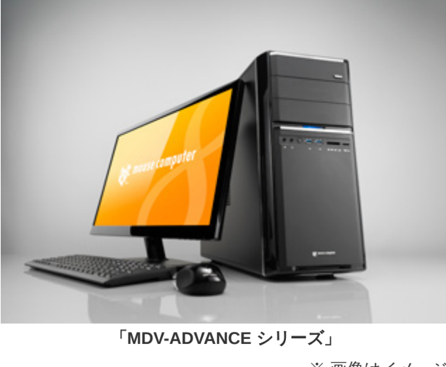
「MDV-ADVANCE シリーズ」 ※画像はイメージです。ディスプレイはオプションとなります。