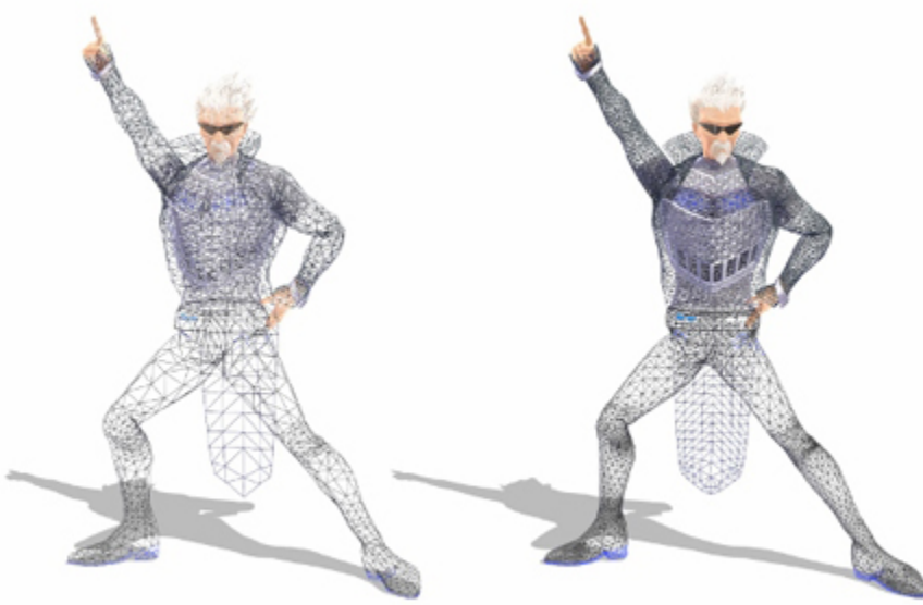
「ワイヤー数比較 左: 通常版 / 右: ハイポリゴン版」

容量を抑えた自由度の高い通常版と、クオリティを重視したハイポリゴン版の2種類のデータを同梱しています。ハイポリゴン版は、通常版に比べてモデルデータを構築するワイヤー数が多く設計されています。