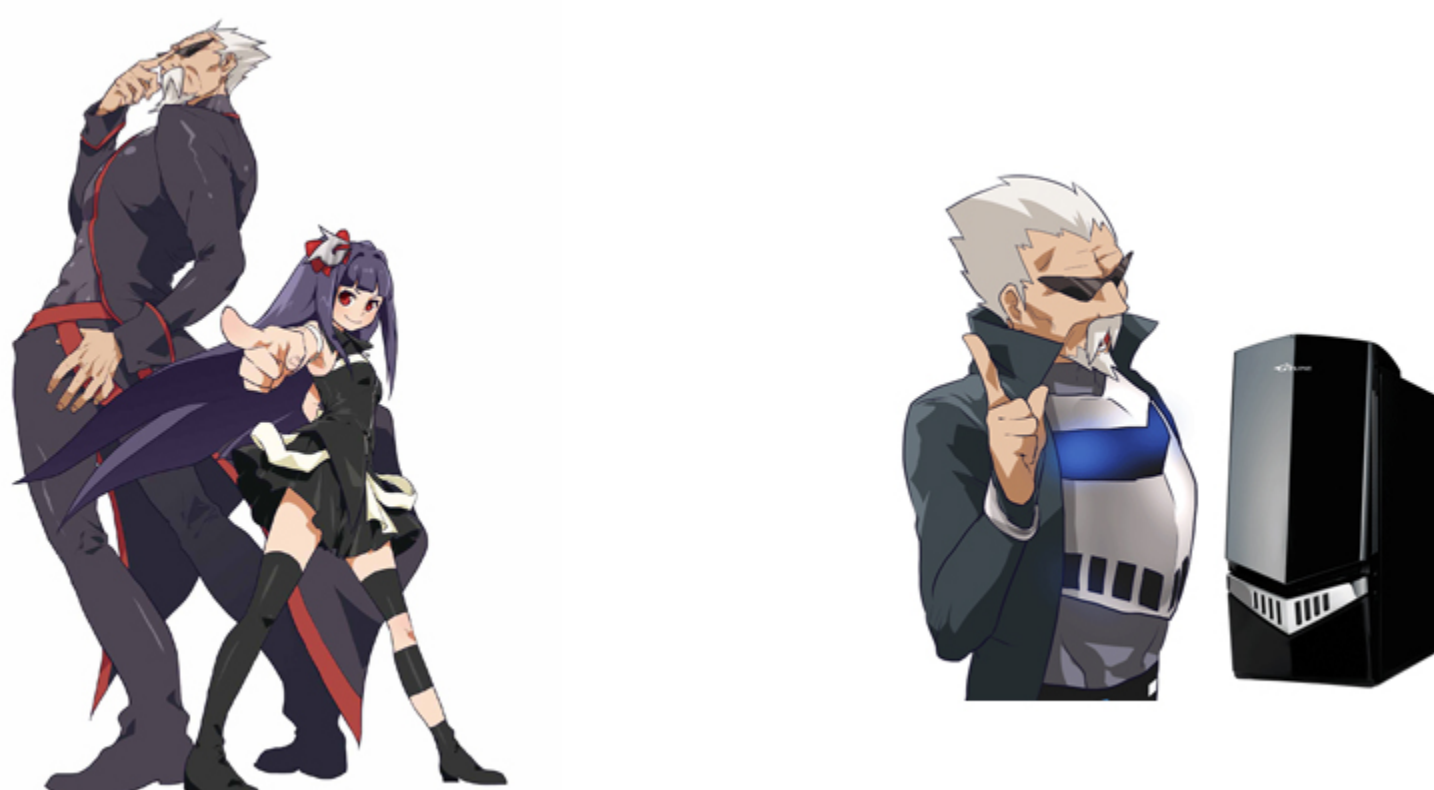
「左: Gちゃん (じーちゃん) 右: Tuneちゃん (ちゅんちゃん)」

「Gちゃん」は、新しいパーツなどを目にするに興奮して若返る特性を持っています。今回配布される「Gちゃん (若返りVer.)」は、その時のキャラクターを再現したMMDモデリングデータとなります。パソコン初心者の方向けの製品紹介漫画や、ゲーム推奨パソコンのコラボレーションアイテム実装など、精力的に活動しています。