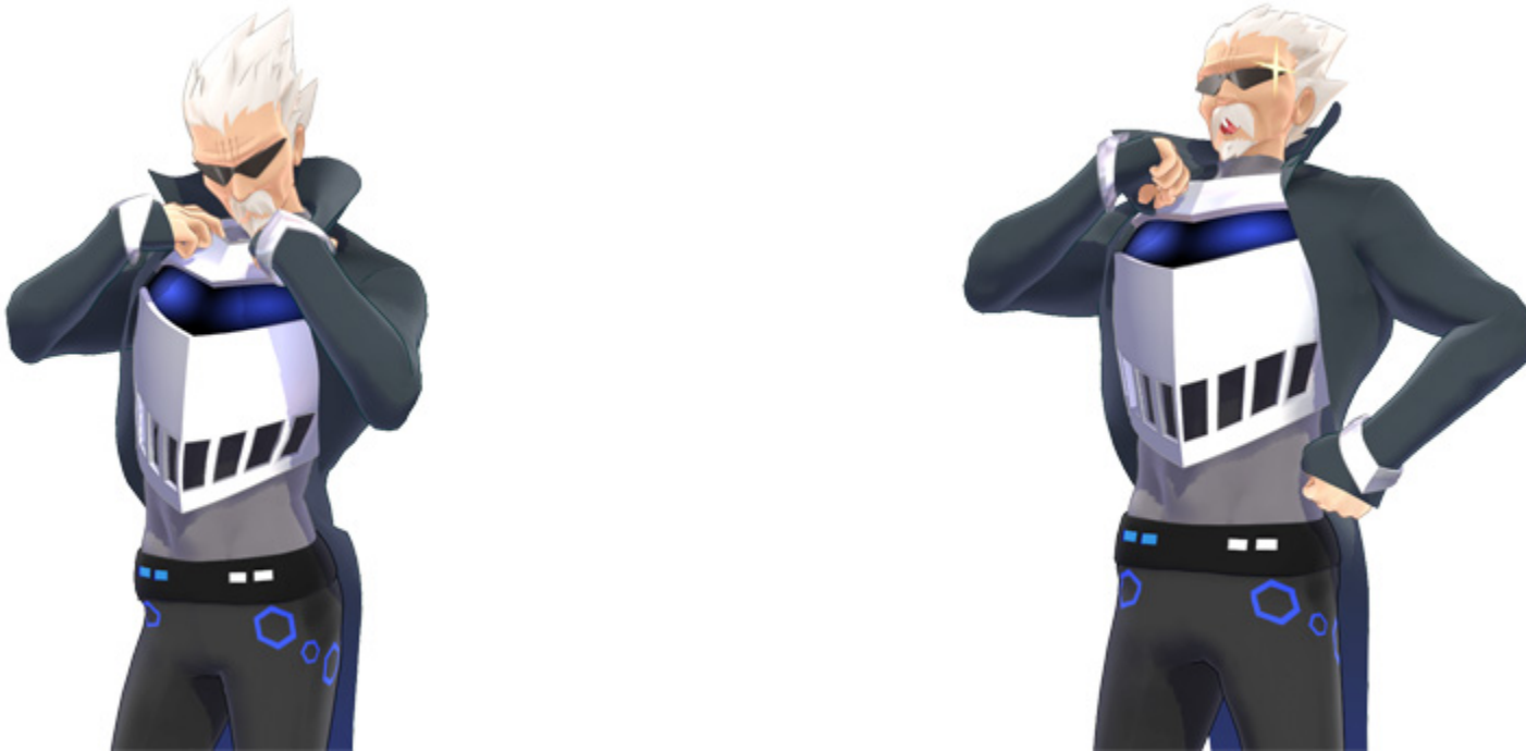
「衣装チェンジGちゃん (NEXTGAER Ver.) MMDデータイメージ」

株式会社マウスコンピューター (代表取締役社長: 小松永門、本社: 東京都) は、マウスコンピューターのゲーミングブランド「G-Tune」より、G-Tuneの公式キャラクター「G-Tuneちゃん (じーちゅんちゃん)」のうち、パソコン・パーツマニアで新製品に目がない「Gちゃん」の衣装をチェンジした「Gちゃん (NEXTGAER Ver.)」のMMD (ミクミクダンス) 向けモデルデータの無償配布を行います。当データは、多数のMMD向けモデルデータを制作されている3Dモデラー「銀獅」氏により制作されています。