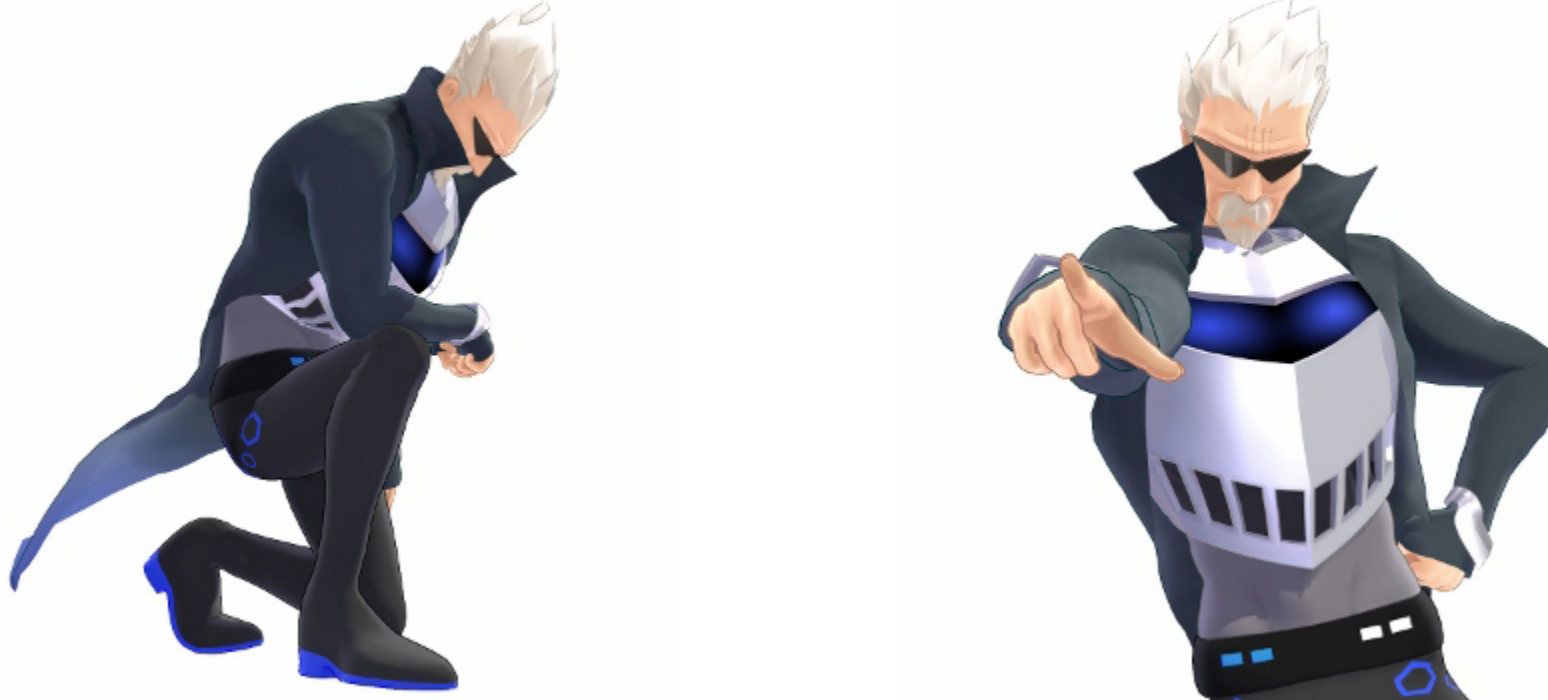
「特製スーツを活かした映像表現」

「Gちゃん (NEXTGAER Ver.)」の個性的な服装を忠実に再現。物理演算が複数のパーツに埋め込まれているため、モデルデータを動かした際に、「Gちゃん (NEXTGAER Ver.)」の特製スーツの裾を活かした躍動感ある動きや、特徴的な甲冑パーツを活かした表現が可能です。