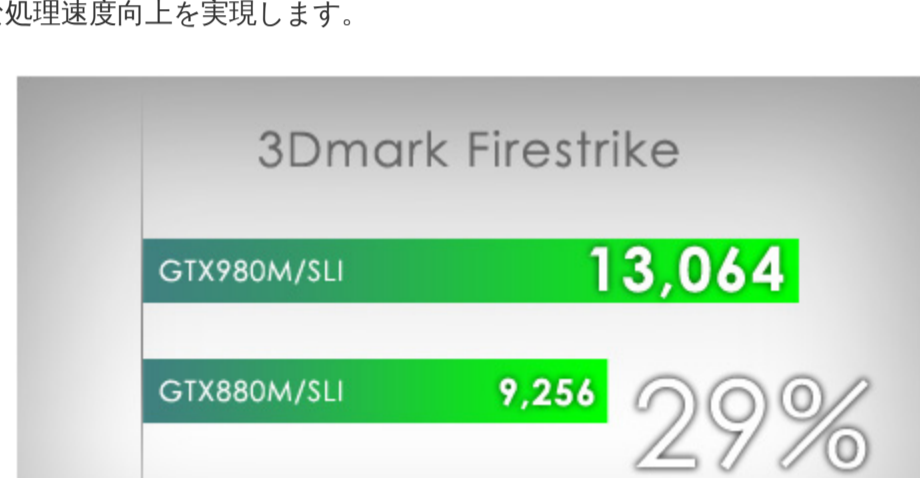
<3D性能ベンチマーク> NEXTGEAR-NOTE i71100BA1 : Corei7-4710MQ、NVIDIAR GeForceR GTX980M-SLI、8GBメモリ NEXTGEAR-NOTE i1100BA1 : Corei7-4710MQ、NVIDIAR GeForceR GTX880M-SLI、8GBメモリ

また、NVIDIA® PhysX™ テクノロジーによる物理演算、NVIDIA® PureVideo® HD テクノロジーによる高精細な映像処理、NVIDIA® CUDA™ テクノロジーによるマルチメディア用途への劇的な処理速度向上を実現します。