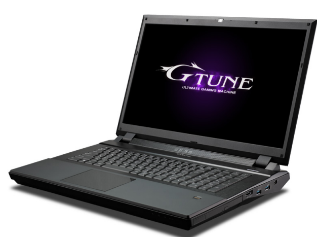
「NEXTGEAR-NOTE i71100シリーズ」 ※画像はイメージです。

～ キーボードバックライトなどの、ゲーマー向け機能を多数搭載 ～ 2014.11.26