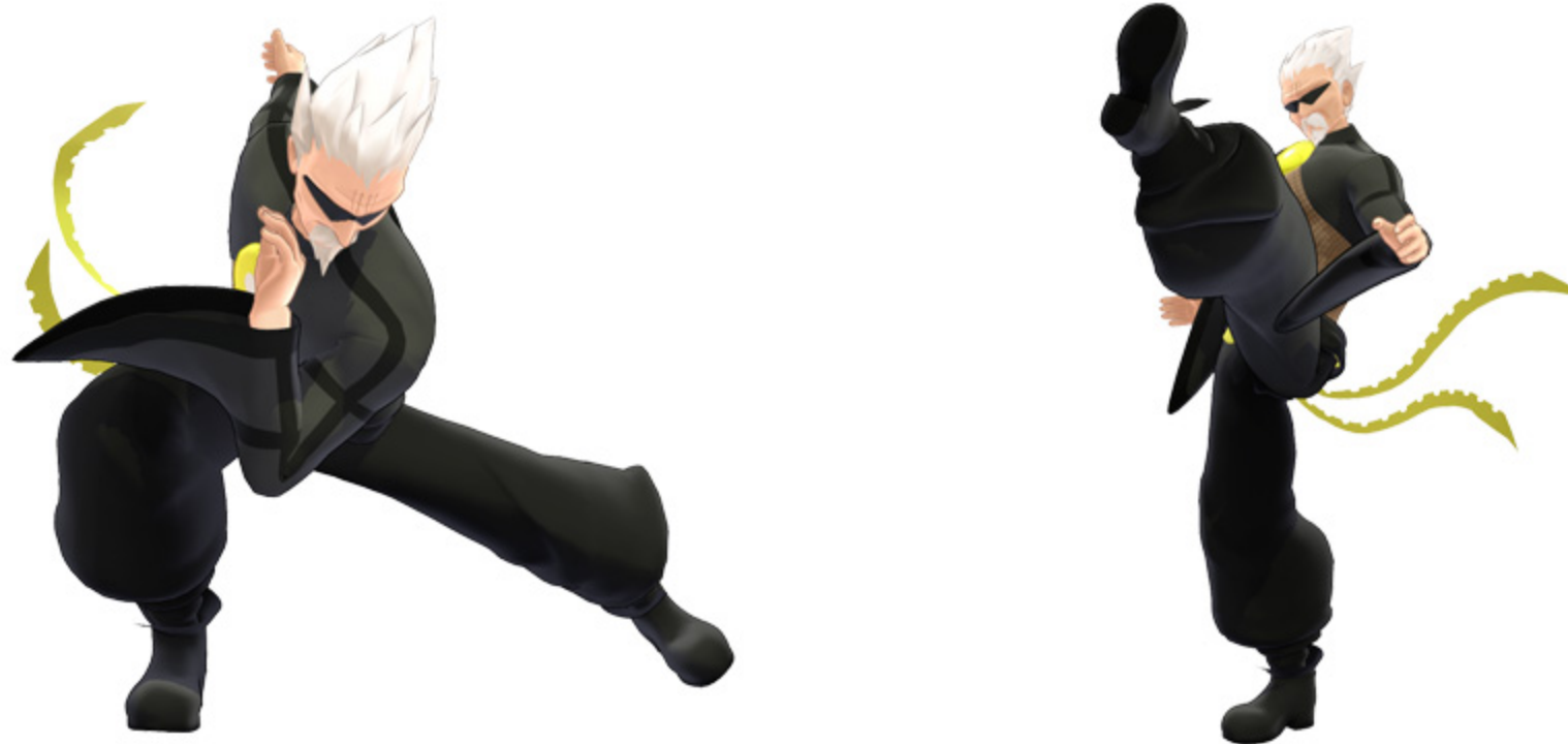
「ベルトや袖を活かした映像表現」

「Gちゃん (NEXTGAER-MICRO Ver.)」の個性的な衣装を忠実に再現。物理演算が複数のパーツに埋め込まれているため、モデルデータを動かした際に、「Gちゃん (NEXTGAER-MICRO Ver.)」のベルトや袖を活かした映像表現が可能です。