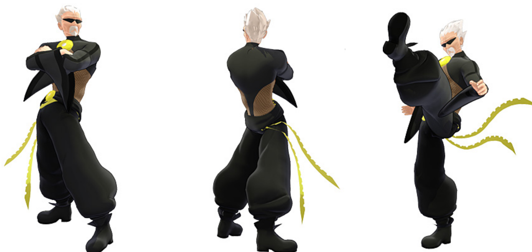
「衣装チェンジGちゃん (NEXTGAER-MICRO Ver.) MMDデータイメージ」

株式会社マウスコンピューター（代表取締役社長：小松永門、本社：東京都）は、マウスコンピューターのゲーミングブランド「G-Tune」より、G-Tuneの公式キャラクター「G-Tuneちゃん（じーちゃん）」のうち、パソコン・パーツマニアで新製品に目がない「Gちゃん」の衣装をチェンジした「Gちゃん (NEXTGAER-MICRO Ver.)」のMMD（ミクミクダンス）向けモデルデータの無償配布を行います。当データは、多数のMMD向けモデルデータを制作されている3Dモデラー「銀獅」氏により制作されています。