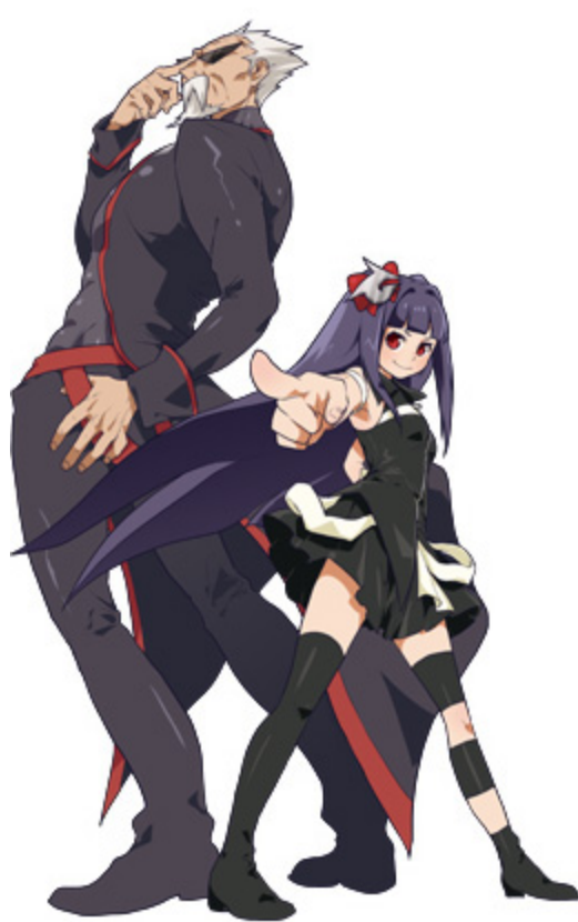
「左：Gちゃん (じーちゃん) 右：Tuneちゃん (ちゅーんちゃん)」

パソコン初心者の方向けの製品紹介漫画や、ゲーム推奨パソコンのコラボレーションアイテム実装など、積極的に活動しています。