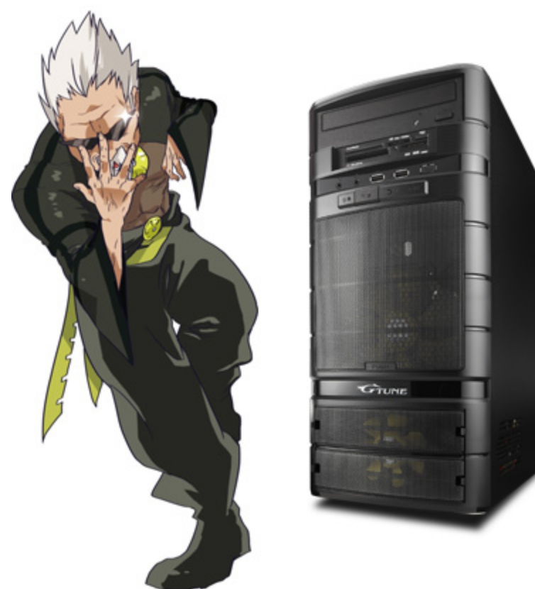
「左：Gちゃん (NEXTGAER-MICRO Ver.) 右：NEXTGAER-MICROシリーズ」