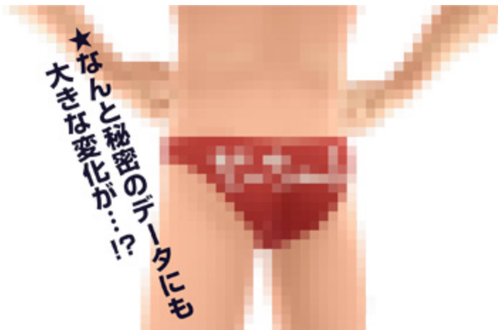
モデル改造される方向けのお楽しみ要素!

また、改造・改変を行うことが可能な上級者の方々に、通常では使用できないおまけ要素が反映されたモデリングデータを、通常版・ハイポリゴン版共に用意しております。是非ご自身の目で確かめてください!