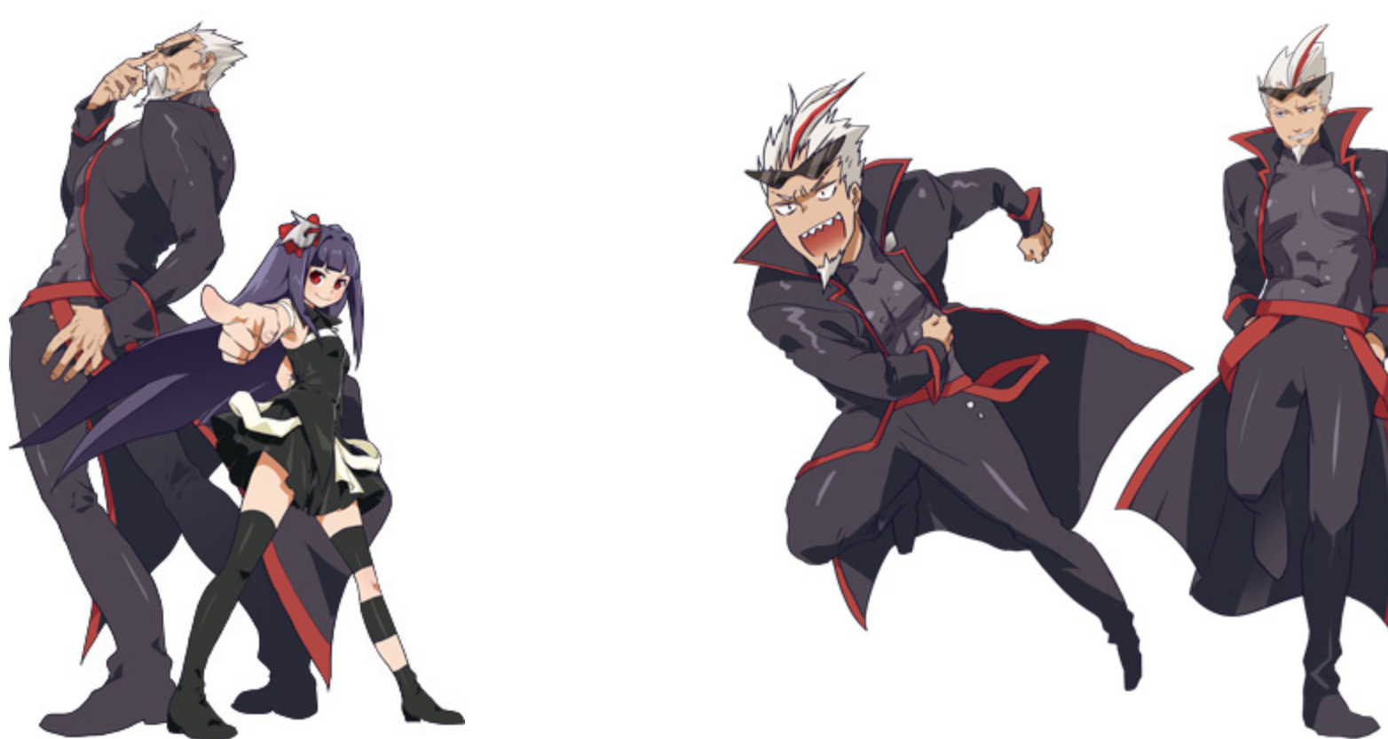
「左: Gちゃん (じーちゃん) 右: Tuneちゃん (ちゅんちゃん)」

パソコン初心者の方向けの製品紹介漫画や、ゲーム推奨パソコンのコラボレーションアイテム実装など、精力的に活動しています。