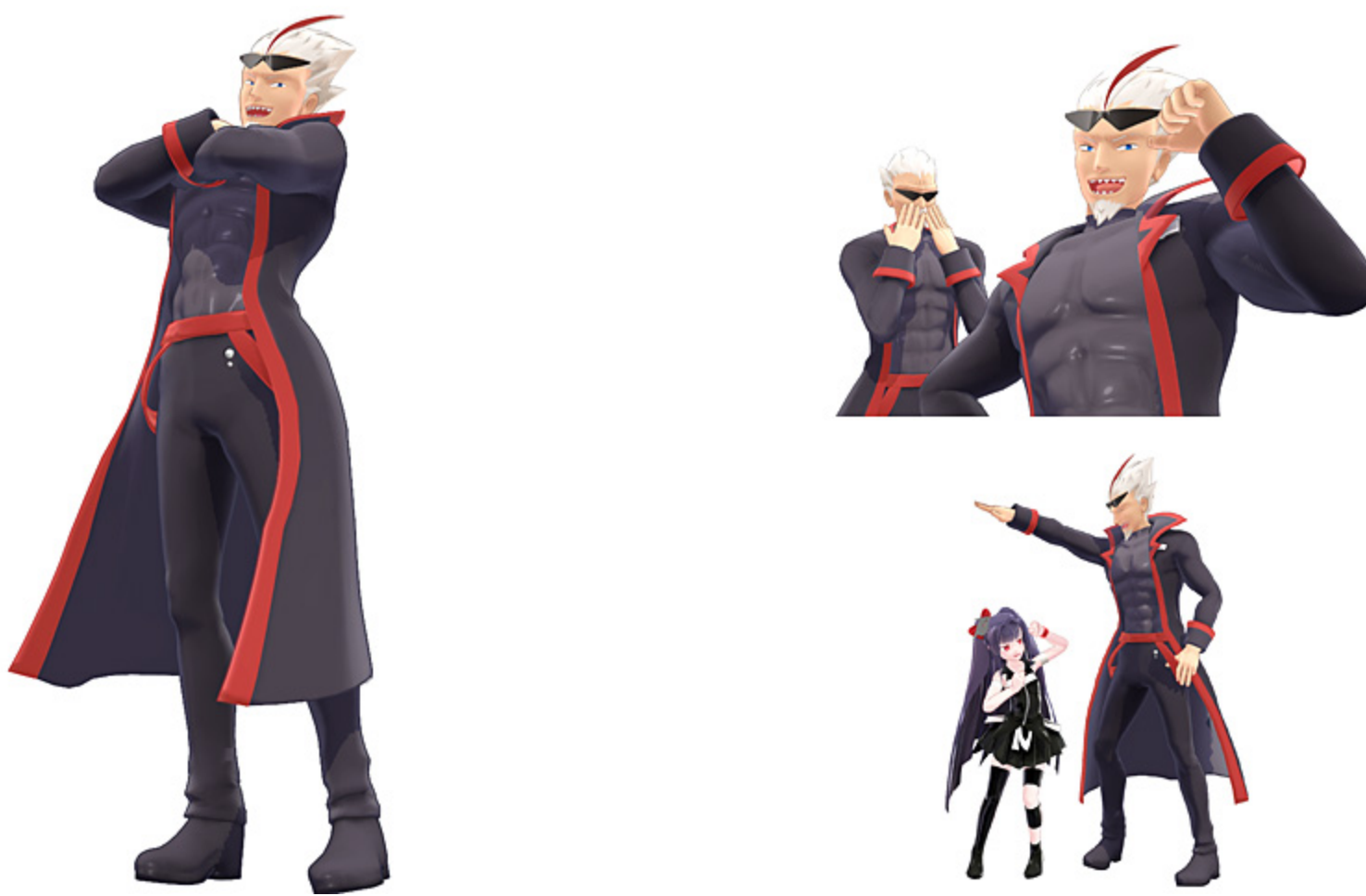
Gちゃん (若返りVer.) MMDデータイメージ

株式会社マウスコンピューター (代表取締役社長: 小松水門、本社: 東京都) は、マウスコンピューターのゲーミングブランド「G-Tune」より、G-Tuneの公式キャラクター「G-Tuneちゃん (じーちゃん)」のうち、パソコン・パーツマニアで新製品に目がない「Gちゃん」が若返った「Gちゃん (若返りVer.)」のMMD (ミクミクダンス) 向けモデルデータの無償配布を行います。当データは、多数のMMD向けモデルデータを制作されている3Dモデラー「銀獅」氏により制作されています。