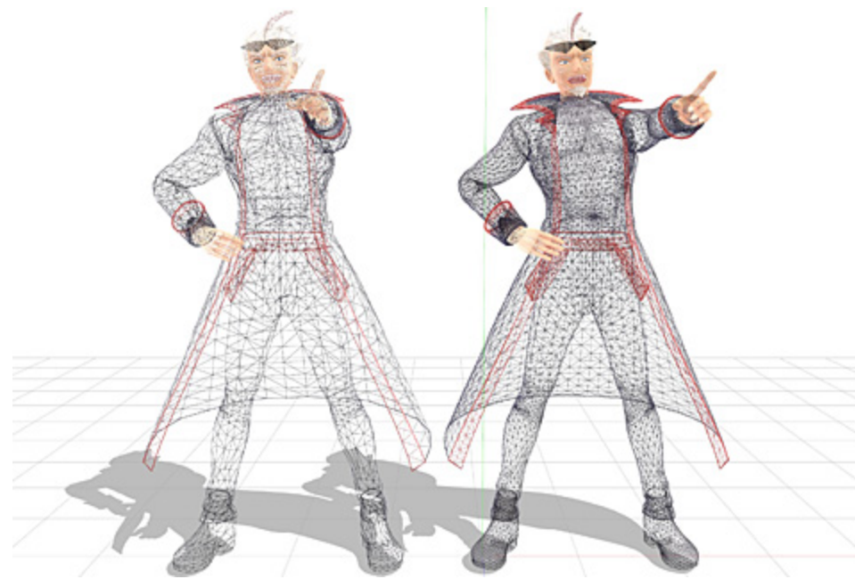
「ワイヤー数比較 左: 通常版 / 右: ハイポリゴン版」

容量を抑えた自由度の高い通常版と、クオリティを重視したハイポリゴン版の2種類のデータを同梱しています。ハイポリゴン版は、通常版に比べてモデルデータを構築するワイヤー数が多く設計されています。