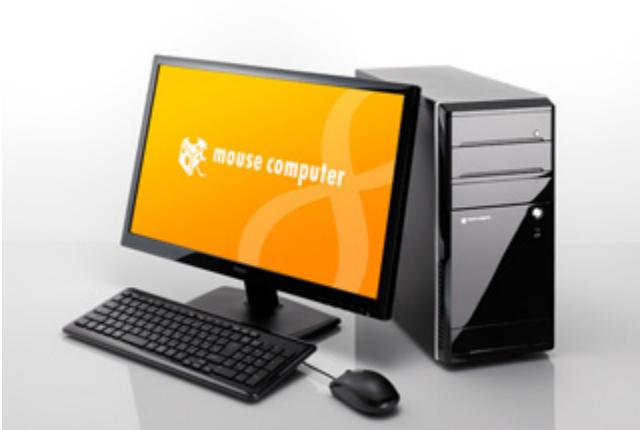
LM-AR313B / LM-AR312S2