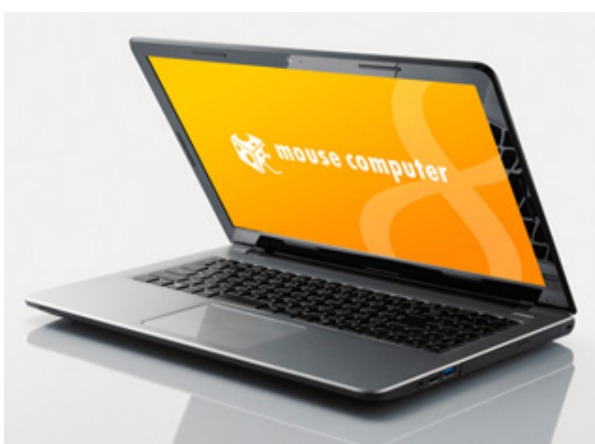
LuvBook Fシリーズ 前面