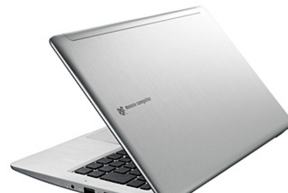
LuvBook C シリーズ 背面