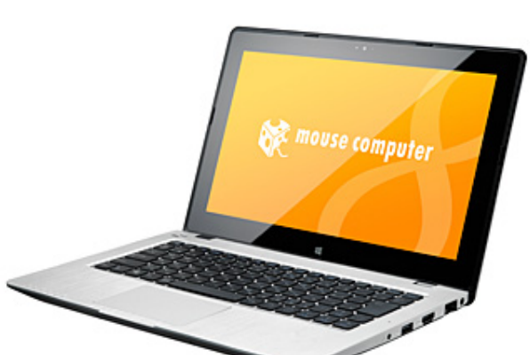
LuvBook C シリーズ 前面

~ タッチパネル搭載モデル、タッチパネル非搭載モデルの2ラインアップ ~ 2014.05.23