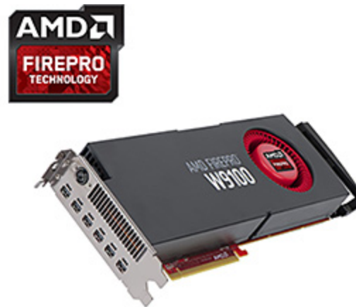
AMD FirePro™ W9100