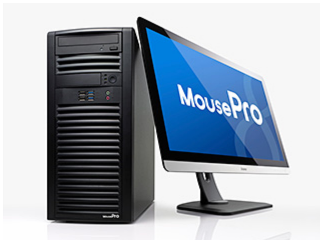
MousePro W シリーズ

～ 16GBの大容量VRAMと超高性能GPUが実現する、プロフェッショナル4Kワークフローへの対応～ 2014.04.15