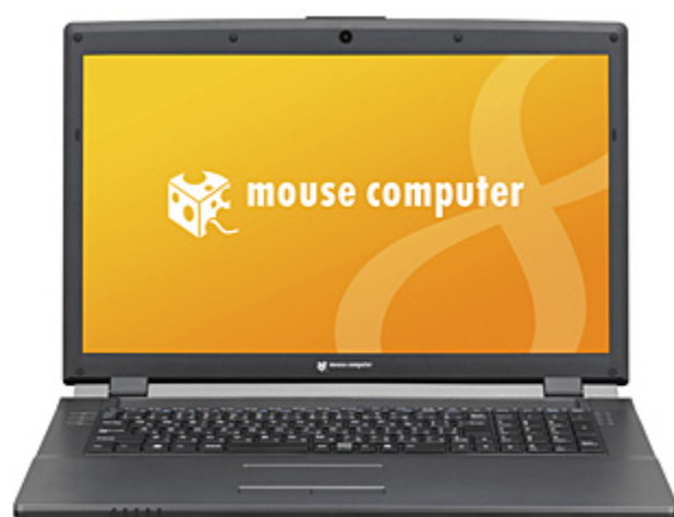
m-Book W シリーズ

～ 第4世代インテル® Core™ i7 プロセッサ搭載でマルチに使えるハイスぺックモデル～ 2014.04.14