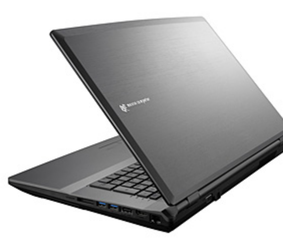
m-Book W シリーズ背面