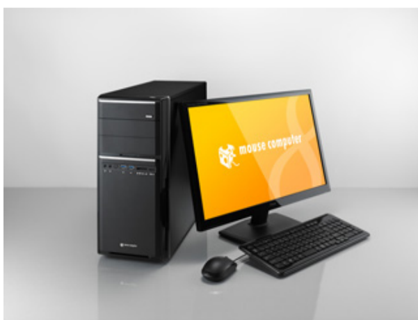
MDV ADVANCE シリーズ

～ 低発熱、低消費電力化された Maxwell (GM107) コアを採用 ～ 2014.03.13