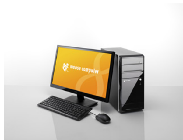
LUV MACHINES シリーズ