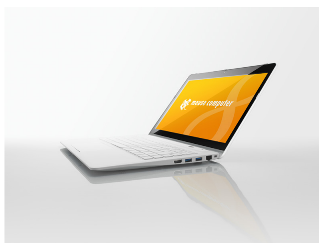
LuvBook L シリーズ

～最新の第4世代インテル® Core™ プロセッサ搭載、機動性重視の Ultrabook～ 2014.02.25