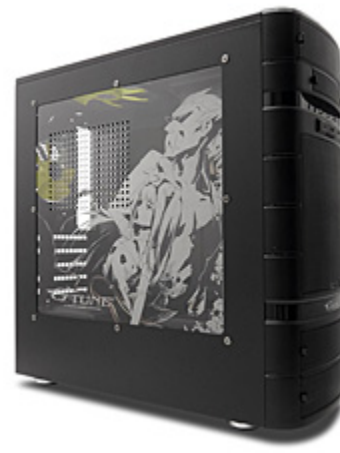
G-Tuneちゃんエディション