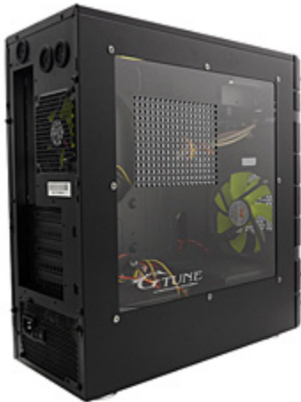
G-Tuneノーマルエディション