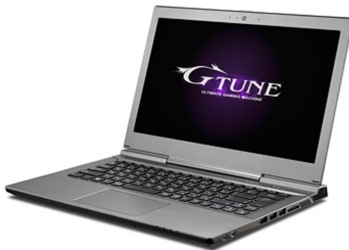
NEXTGEAR-NOTE i200 シリーズ