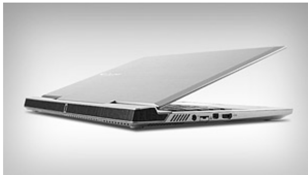
薄さ 21mm を実現

参考ベンチマークデータ: 内蔵グラフィックスでありながら、パワフルな映像描写が可能