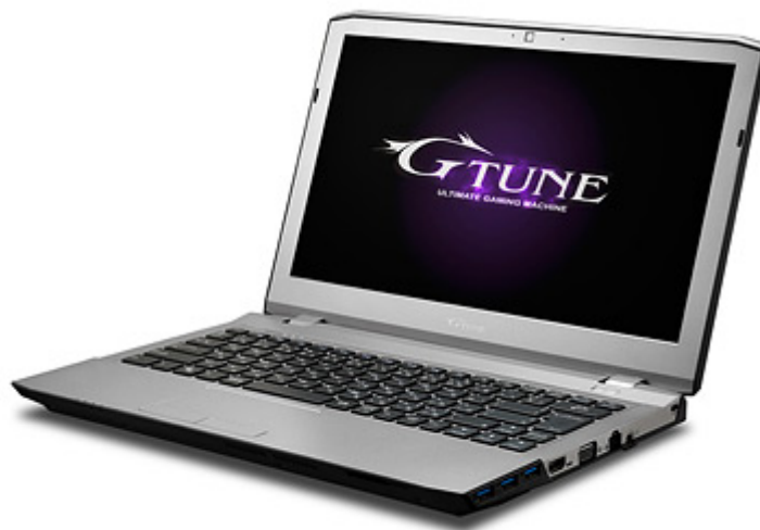
NEXTGEAR-NOTE i410 シリーズ