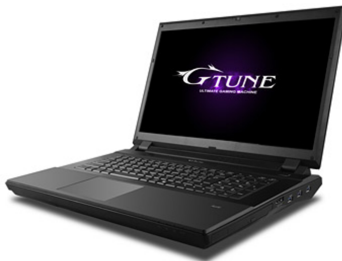
NEXTGEAR-NOTE i1100 シリーズ