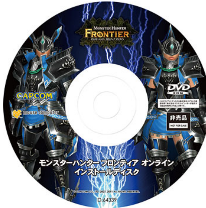
<ピクチャーレーベル仕様オリジナルインストールディスク>

ピクチャーレーベル仕様のディスク盤面が特長の「オリジナルゲームパッケージ」が付属します。