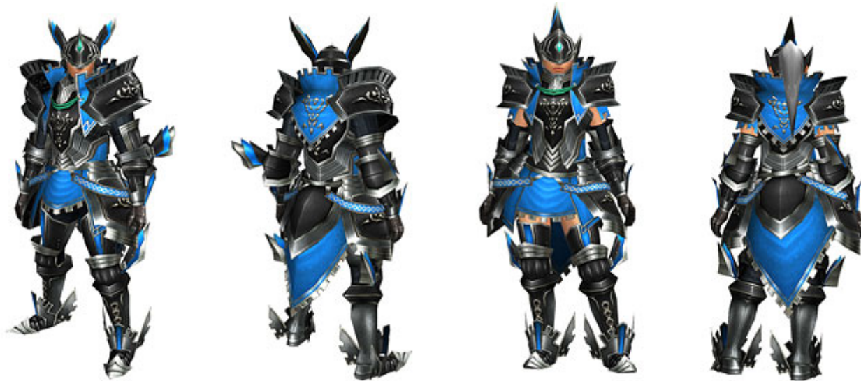
<フィディシリーズ>(剣士・ガンナー共用防具)

「フィディシリーズ(剣士・ガンナー共用防具)」の生産には「マグネストーン」が5つ必要となります。