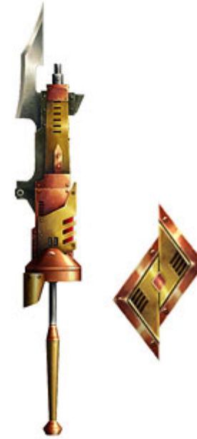
<アクシリスイデア I > (ガンランス)

「ポルトランス I【青】」(ランス)、「アクシリスイデア I」(ガンランス)の生産にはそれぞれ「マグネストーン」が1つ必要となります。