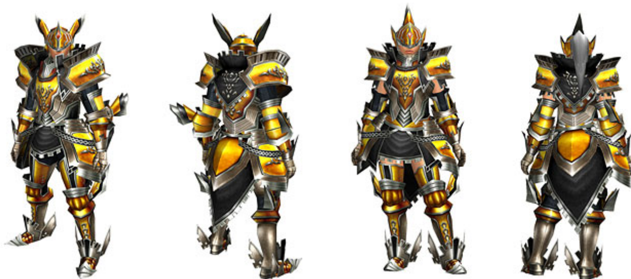
<テリオグシリーズ>(剣士用防具・ガンナー用防具)

「フィディシリーズ(剣士・ガンナー共用防具)」の生産には「マグネストーン」が5つ必要となります。