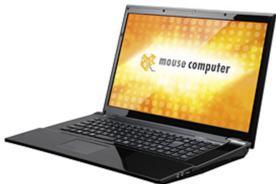
LuvBook D シリーズ 正面