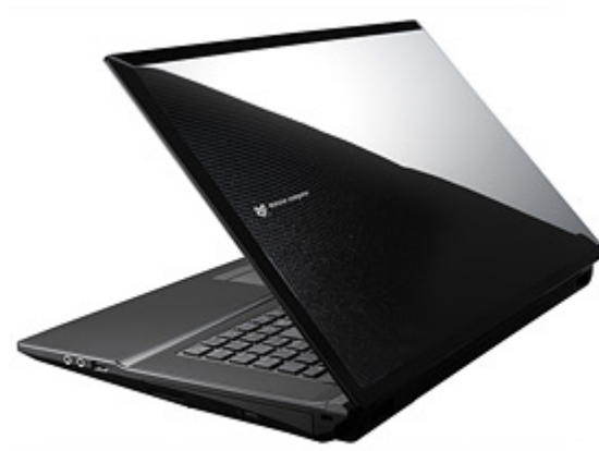
LuvBook D シリーズ 背面