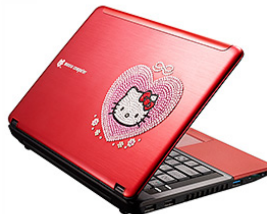
LuvBook S ハローキティ・モデル