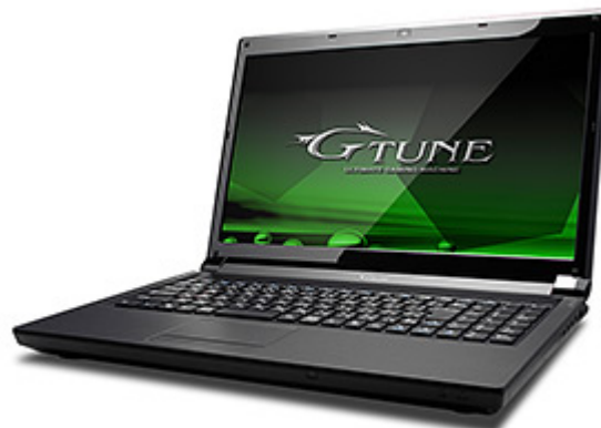
NEXTGEAR-NOTE i750 / i751シリーズ