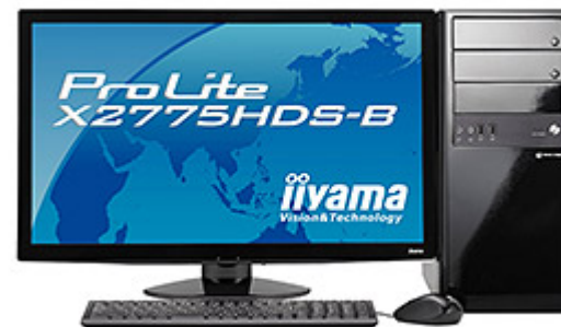
MDV ADVANCE S シリーズ