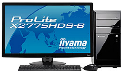
LUV MACHINES シリーズ