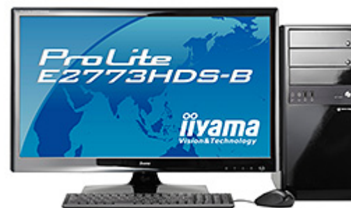
MDV ADVANCE S シリーズ