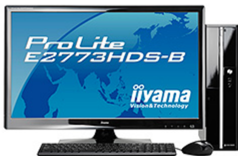
LUV MACHINES Slim シリーズ