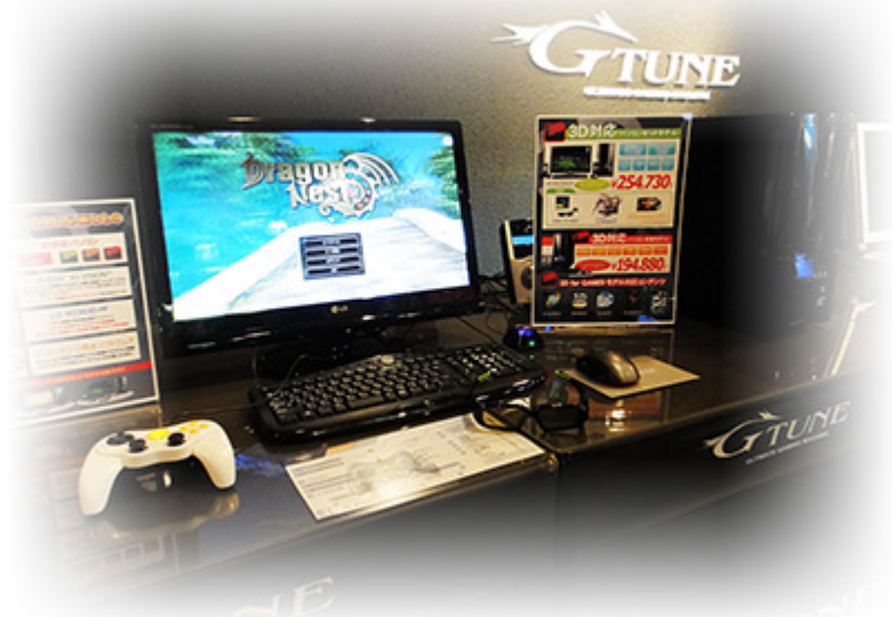
マウスコンピューター秋葉原ダイレクトショップ 【G-Tune: Garage(ジー・チューン ガレージ)】